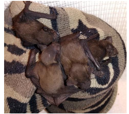
5 junge Zwergfledermäuse

Auffallend viele Jungtiere mussten gerettet werden. An einem warmen Sommertag lief das Nottelefon heiss. Wir hatten alle Hände voll zu tun, die Jungtiere aufzunehmen, und wenn möglich dann am Abend wieder ihren Müttern anzubieten. So fielen aus einem einzigen Quartier 19 Jungtiere auf eine Kellertreppe. Sie wurden durch unsere Fachkräfte tagsüber gefüttert. Zum Glück konnten sie am Abend unversehrt ins Quartier zurückgebracht werden. Die Begrüssungsrufe der Mütter waren unüberhörbar.