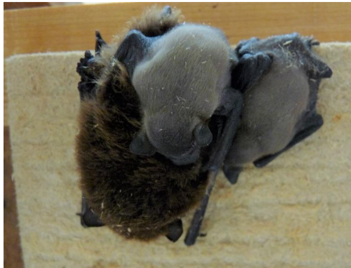
Weissrandfledermaus mit Zwillingen

Die grosse Zahl an Fledermauspflinglingen in unserem Kanton kann nur durch ehrenamtliche Fachpersonen mit einer entsprechenden Ausbildung bewältigt werden. In unserem Kanton leisten 15 ausgebildete Fachpersonen Einsatz in den Pflegestationen.